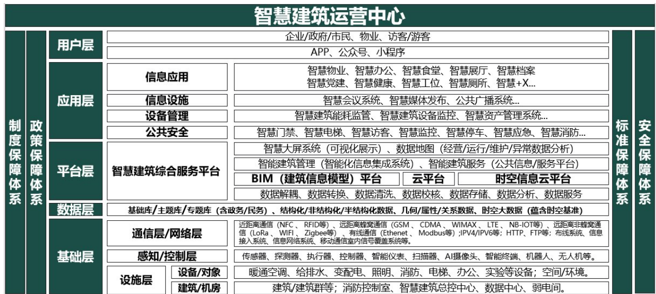
图4 系统集成商心目中的智慧建筑模型