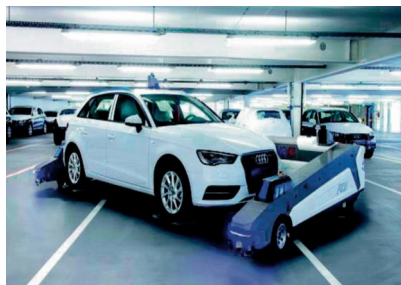
图4 夹持轮胎式停车AGV示意图

夹持轮胎式停车AGV能直接钻入车辆下面,利用夹持装置将车辆轮胎夹起,把汽车送到停车位上。与梳齿型相比,它有结构简单、安装方便快捷等优点,但速度比梳齿型的慢(见图4)。