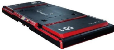
图3 车台板式停车AGV示意图

车台板式AGV工作方式:汽车停放在车抬板上,AGV钻入车抬板底下举升,然后把汽车和车台板一同运送到指定停车位置上。汽车停放好后,AGV要去抬其他车台板,以便停放下辆汽车。此类停车AGV需要每个停车位上均有车抬板装置。这种AGV因牵涉到要取空车板或存空车板的情况,搬运效率较低,但是制造难度较小,方便安装,成本较低(见图3)。