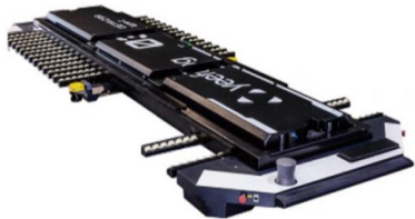
图2 梳齿式停车AGV示意图

梳齿式停车AGV工作方式为:内梳齿固定,外梳齿设置在AGV上,搬运器利用梳齿间隙,通过AGV上下升降移动实现梳齿的交叉换位,从而实现车辆的搬运交接。适用于现有经改造的或新建的平面停车库等汽车搬运领域,运行效率相对其他类型更高。但是伸出的梳齿需要支撑起整辆汽车的承重,对强度和刚度要求较高,制造工艺难度大(见图2)。